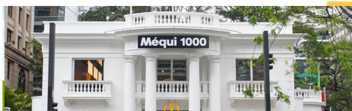
Restaurante emblemático "Méqui 1000" - San Pablo

Clique aqui para acessar nosso Relatório de Compromisso Social e Desenvolvimento Sustentável.