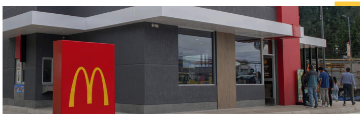
Restaurante emblemático - La Prensa, Quito.

Clique aqui para acessar nosso Relatório de Compromisso Social e Desenvolvimento Sustentável.