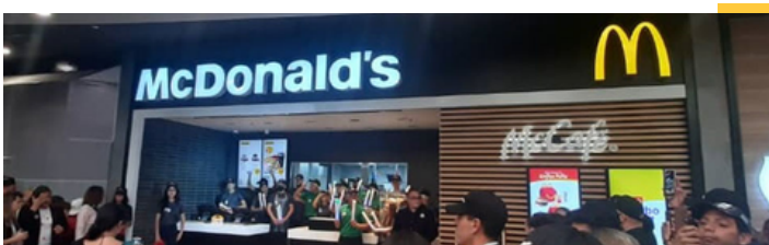
Restaurante emblemático - Sambil, La Candelaria.

Clique aqui para acessar nosso Relatório de Compromisso Social e Desenvolvimento Sustentável.